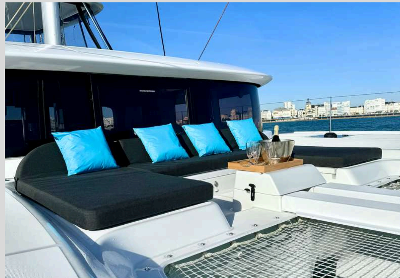
LES ESPACES DE BRONZAGE & DE DETENTE