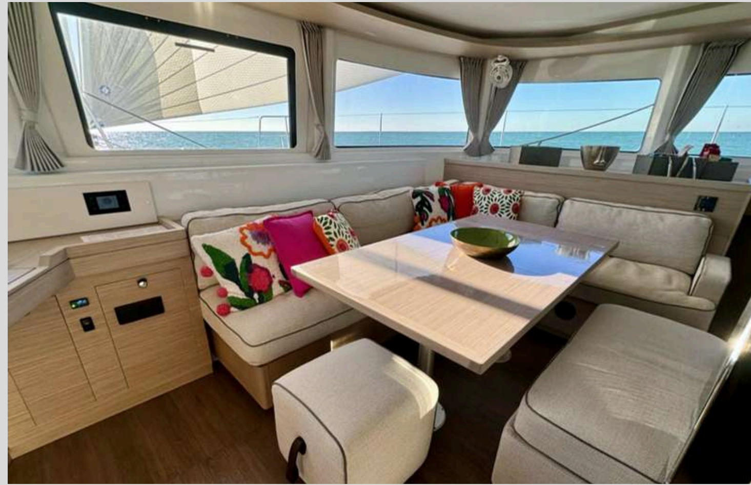
LES SALONS EXTERIEUR & INTERIEUR